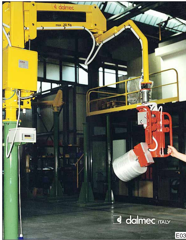
Dalmec Partner balancer in kolomuitvoering voorzien van spandoorn en kantelcilinder. Een speciale weegunit controleert het gewicht van de opgenomen klos.