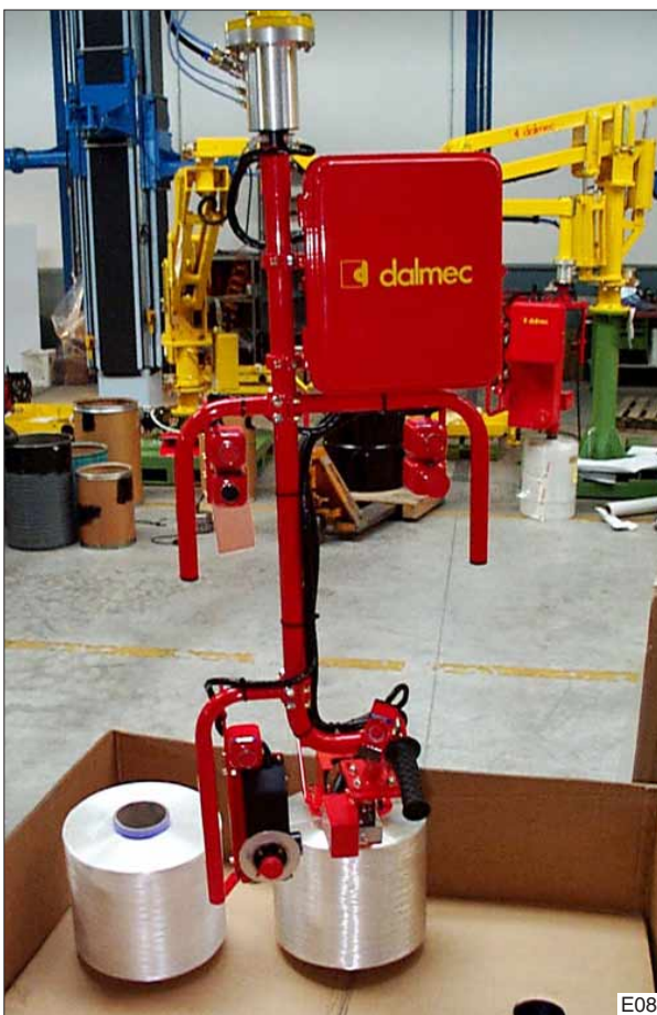
Door de klossen in de huls te klemmen is de kans op beschadiging van het gewikkelde materiaal minimaal.