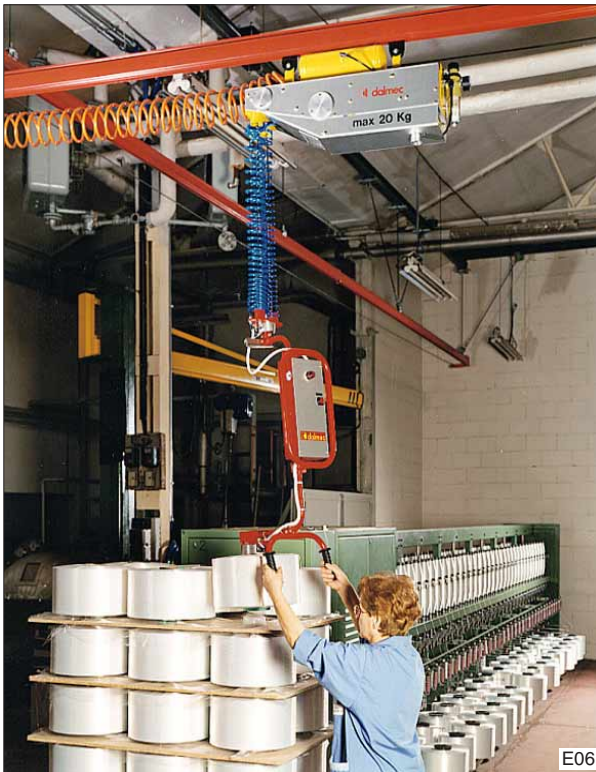
Met deze Mini-Partner , gemonteerd in een dubbelzijdig verrijdbaar profiel, kan een groot werkbereik gerealiseerd worden.