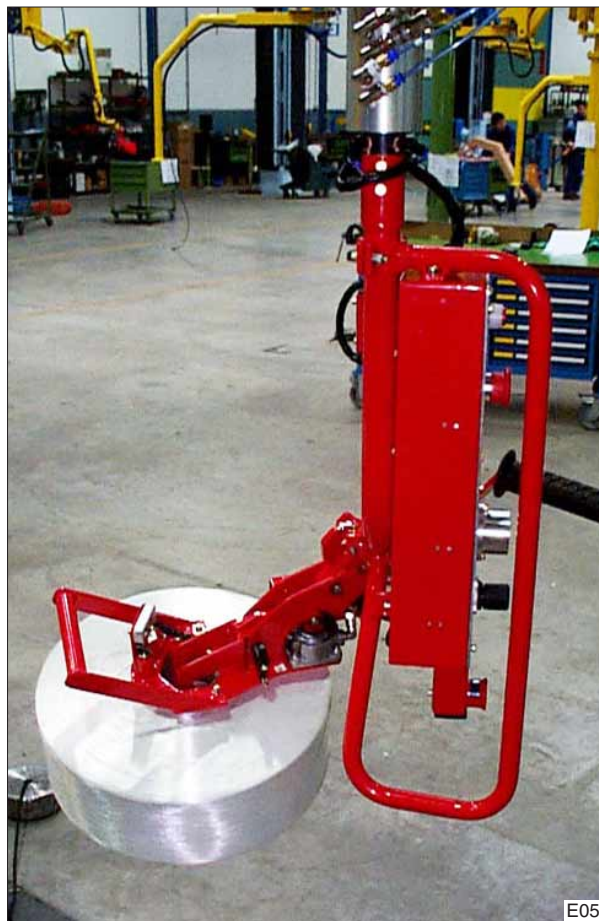
Klossen met spandoorn opnemen en handmatig roteren van horizontale naar verticale positie en visa versa.