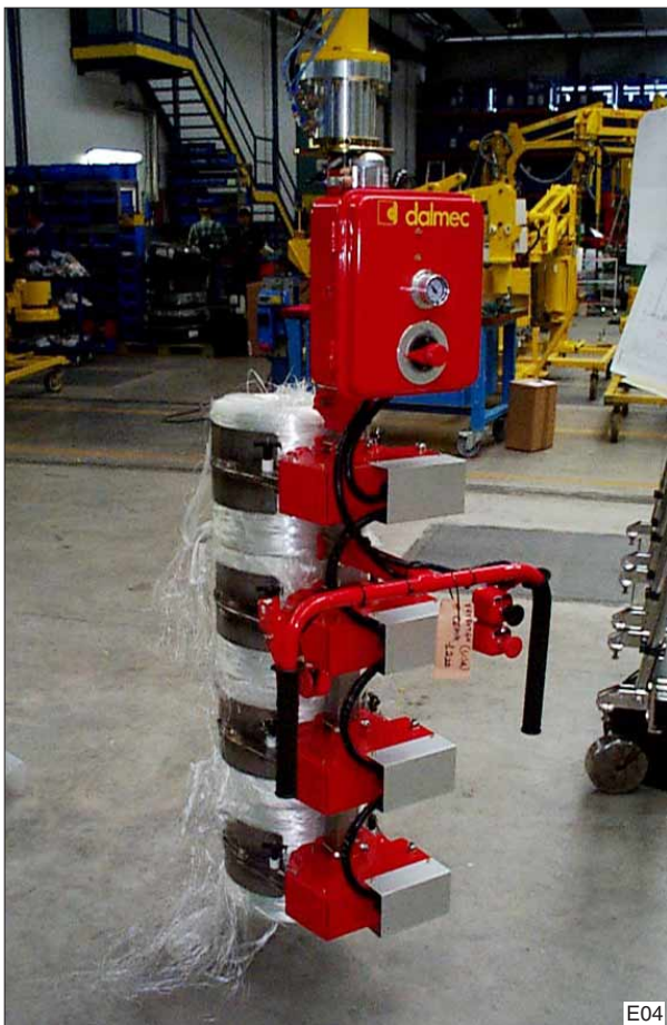
Vier rollen glasvezel gelijktijdig opnemen door ze aan de buitenzijde te klemmen.