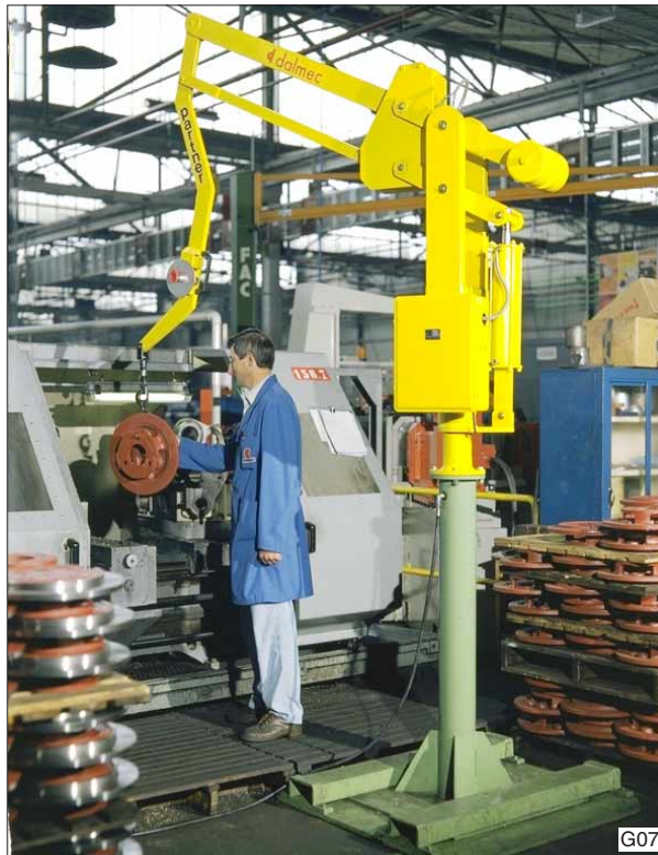
Dankzij de speciale 'zwanenhals – eindarm' van deze Dalmeccan Partner balancer, type PSC, kan de CNC gestuurde draaibank eenvoudig en snel beladen worden zonder de bank te raken.