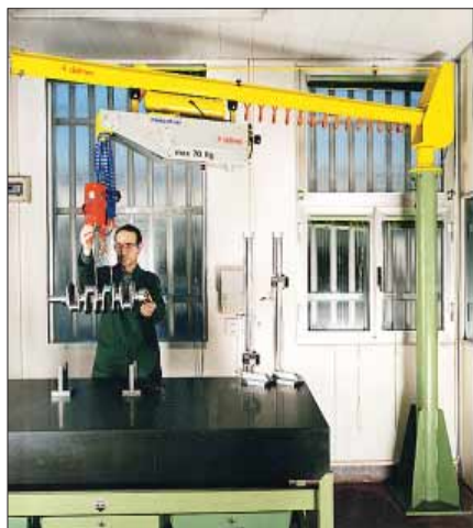
max 80 Kg MINIPARTNER