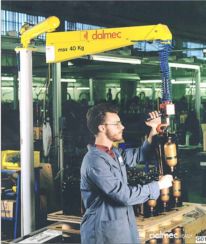
Dalmeccan Posivel balancer, type PVC, in kolomuitvoering, toegepast voor het opnemen en van verplaatsen van onderdelen voor een airconditioner