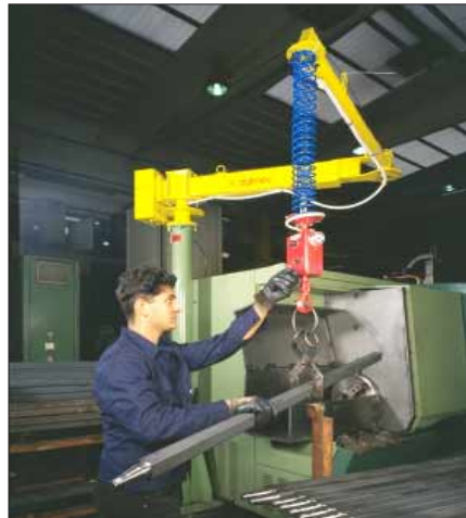
max 80 Kg POSIFIL