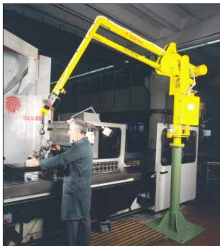
max 300Kg PARTNER PS