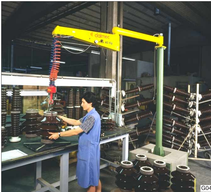
Met de Dalmeccan Posivel balancer, type PVC, kan iedereen zware isolatoren schijnbaar gewichtloos opnemen en verplaatsen.