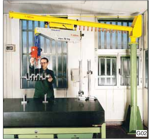
Het nauwkeurig plaatsen van een nokkenas op een meettafel met de Dalmeccan Mini-Partner balancer, type MPC, in verrijdbare uitvoering op kolom.