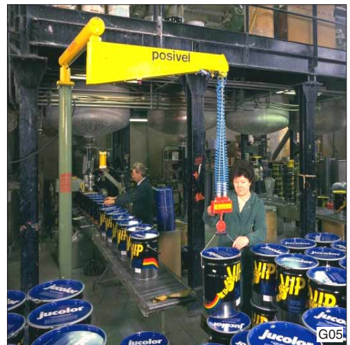
Zware emmers palletiseren wordt kinderspel met de Dalmeccan Posivel balancer, type PVC, in kolomuitvoering.