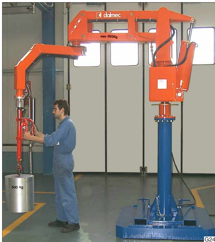
In lage ruimten kan een Dalmec Partner , type PRC, uitkomst bieden.