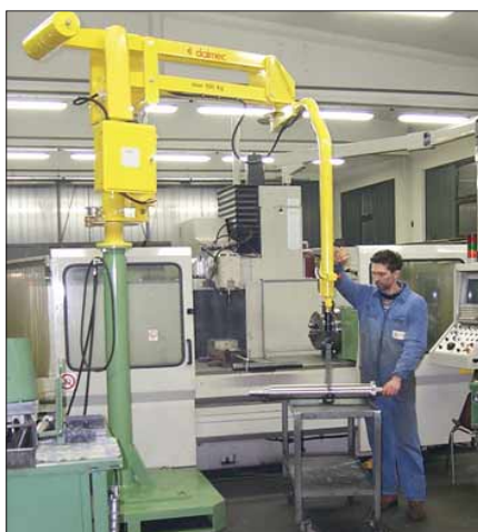
max 250 Kg PARTNER PR