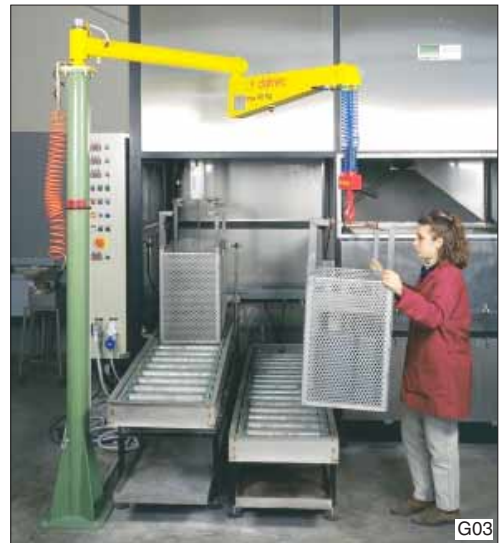
Zware gaaskratten moeiteloos op een rollenbaan voor de wasinstallatie plaatsen met de Posivel balancer, type PVC, in kolomuitvoering.