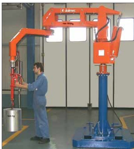
max 550 Kg MAXIPARTNER