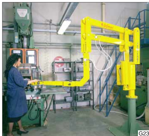
De Dalmec Maxi-Partner , type MXC, in kolomuitvoering, neemt producten tot 550 kg. schijnbaar gewichtloos op.