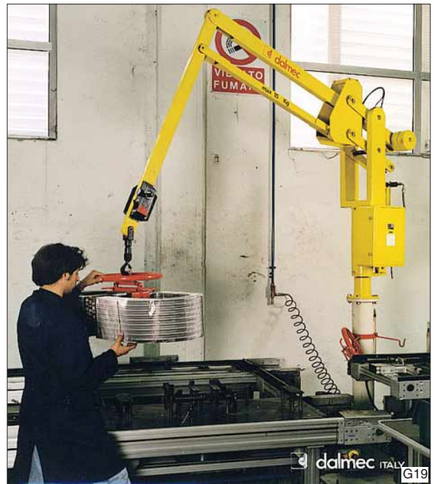
Zware navens opnemen en verplaatsen met de Dalmeccan Partner balancer, type PSC, op kolom.