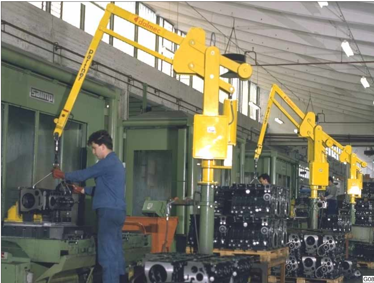
Elk werkstation zijn eigen Dalmeccan Partner balancer, type PSC. Zwaar tillen behoort nu echt tot het verleden.