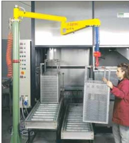
max 50 Kg POSIVEL

Dalmec is internationaal marktleider op het gebied van pneumatisch werkende balancersystemen. Machines ontwikkeld en gebouwd om zware fysieke arbeid te verlichten. Het tillen van dozen, zakken, plaatmateriaal, rollen, vaten, halffabrikaten, pallets etc. wordt kinderspel met de Dalmec balancer, die het product schijnbaar gewichtloos maakt. Er zijn verschillende typen balancersystemen: Posivel, Posifil, Mini-Partner, Partner en Maxi-Partner , die hangend of staand gemonteerd kunnen worden. Oneindig veel toepassingsmogelijkheden in elke tak van industrie door gebruik te maken van een eenvoudige haak of een speciaal ontworpen lastopnemer. Maar altijd toegespitst op uw specifieke werksituatie. In deze documentatie vindt u een aantal voorbeelden van balancersystemen die uitgevoerd zijn met een haak, voor het schijnbaar gewichtloos opnemen en verplaatsen van lasten van 0 tot 550 kg.