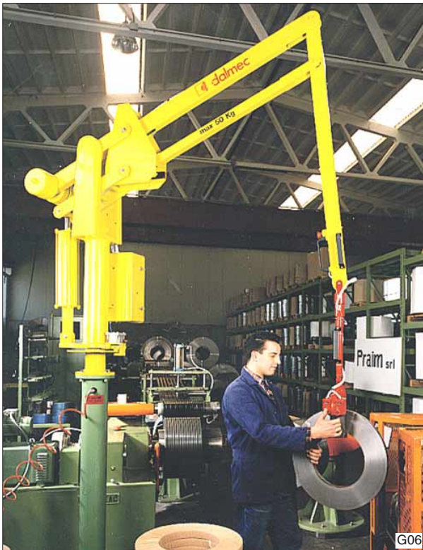
Dalmeccan Partner balancer, type PSC, in kolomuitvoering voor het opnemen en verplaatsen van rollen staalband.