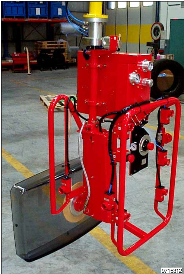
Lastopnemer voor het opnemen, kantelen en roteren van beeldschermen.