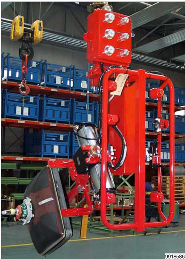
Bediening op twee niveaus. Ergonomie in optima forma.