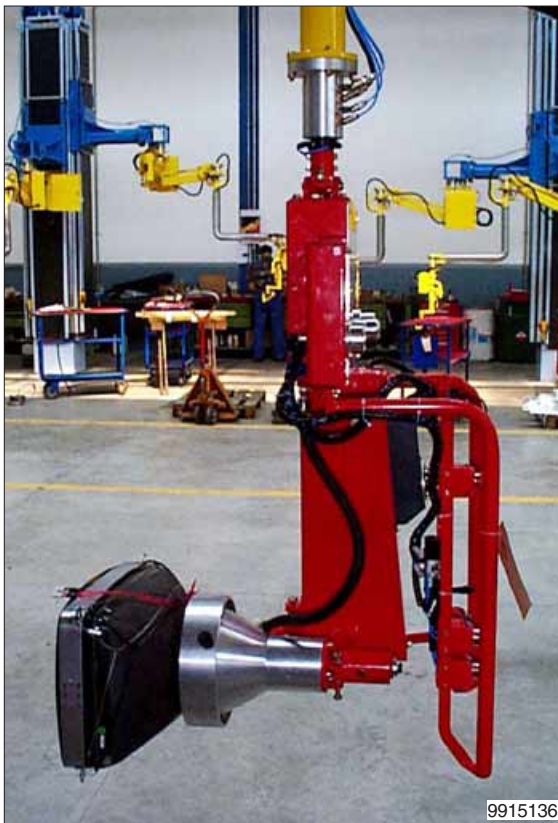
Vier kleine zuigschaaltjes zijn genoeg om zware beeldbuizen veilig op te nemen.