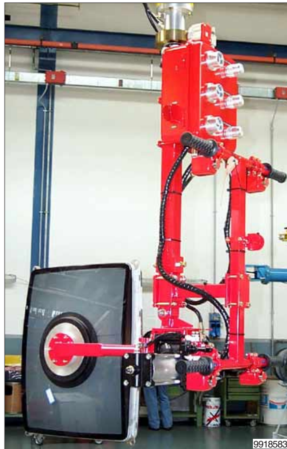
Een zuigschaal met extreem lage bouwhoogte