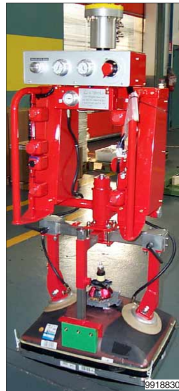
Dankzij de instelbare zuigschalen kunnen veel typen beeldbuizen opgenomen en 90° gekanteld worden.