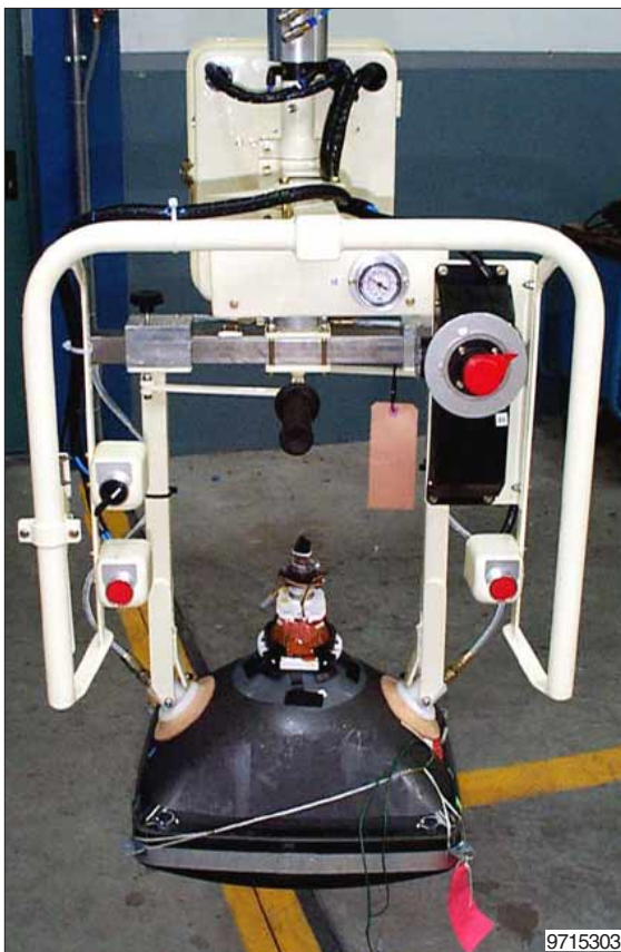
Lastopnemer voor het opnemen en 90° kantelen van de beeldbuis.