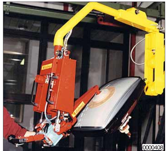
Een lastopnemer voor het opnemen, kantelen en 180° draaien van beeldbuizen, zodat ze in een testmachine geplaatst kunnen worden. Opname gebeurt door venturi-vacuüm.