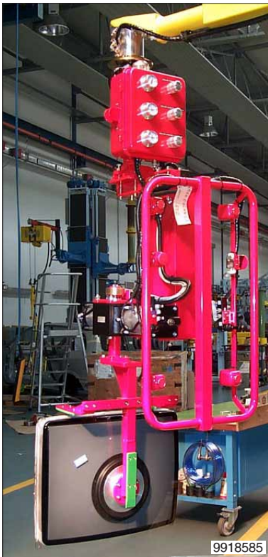
Draaien en kantelen van beeldbuizen wordt kinderspel met de Dalmec Partner balancer.