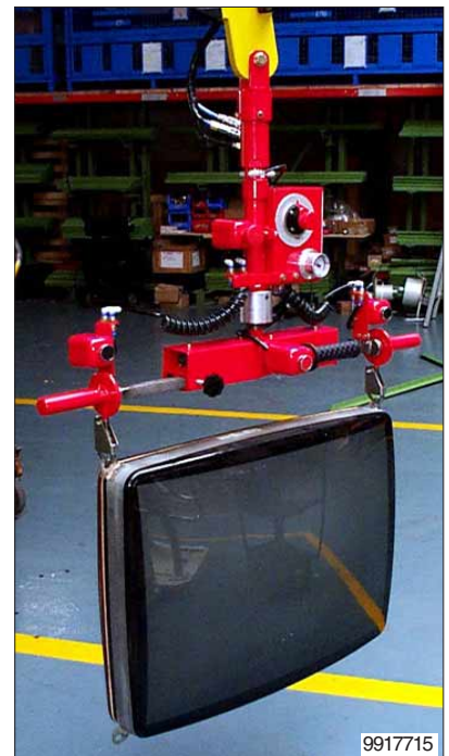
Lastopnemer met een speciale vacuüm-zuigschaal, gemonteerd aan een Partner balancer. Het draaien van de pallet gebeurt pneumatisch met een dubbelwerkende rotatiecilinder.