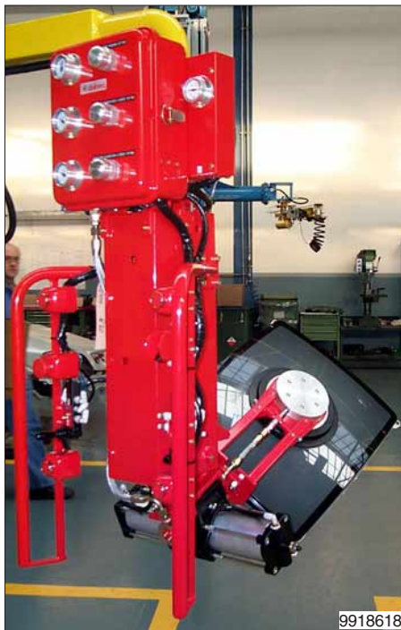
Met deze lastopnemer kan de beeldbuis in elke gewenste stand geplaatst worden.