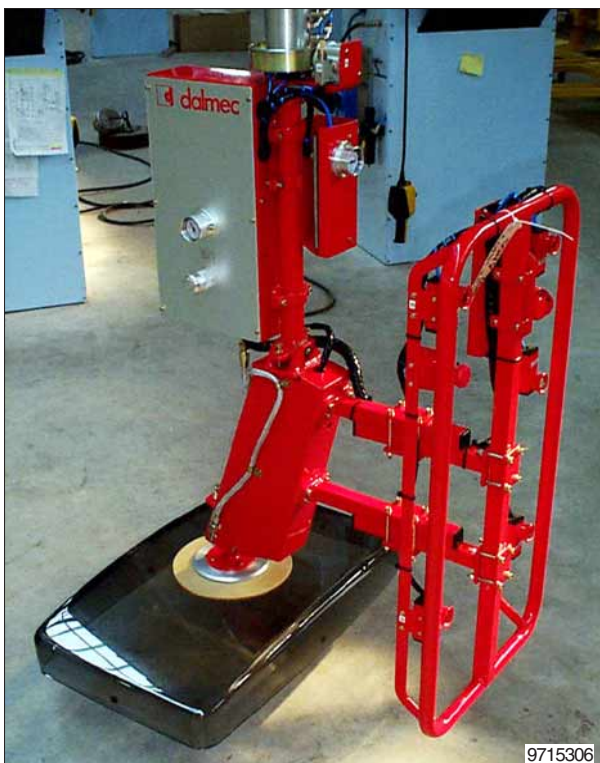
Compact bouwen voor een optimaal bedieningsgemak van de operator.